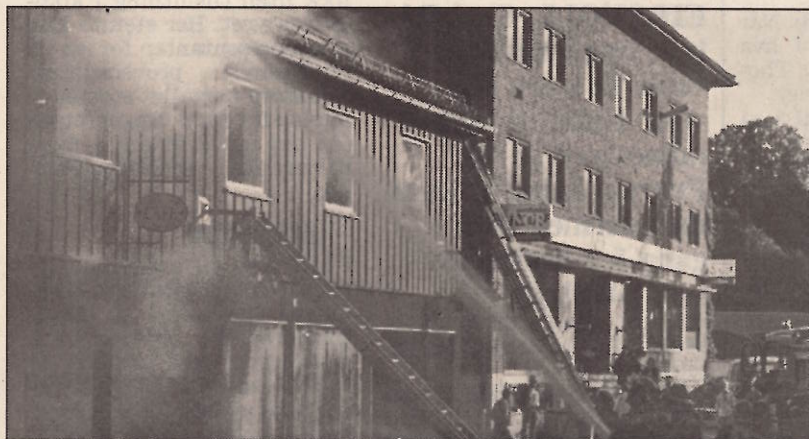
SJANSELØSE: Over 20 brannfolk fra Eidsvoll brannvesen gjorde hva de kunne for å slukke den voldsomme brannen i Sundgaarden café totalskadet i den voldsomme brannen.

At nabogårdene er bygd i mur, var trolig med på å hindre at brannen spredte seg.